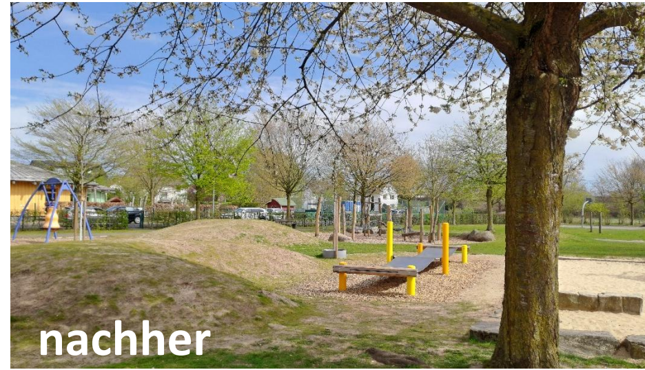
Projekt: Sp Rhedaer Straße