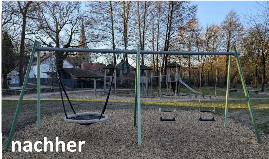
Projekt: Sp Bockemühlenfeld