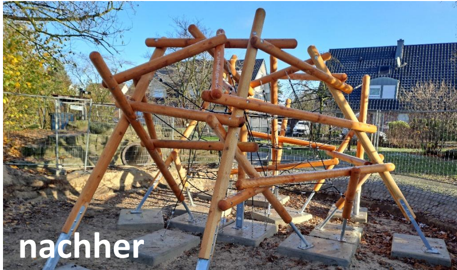
Projekt: Sp Cordulastraße