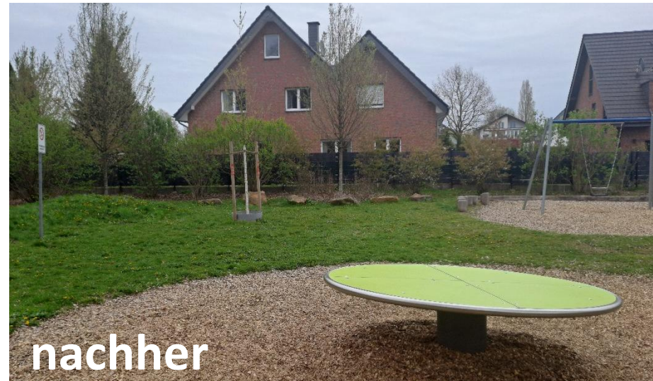
Projekt: Sp Auf der Horst