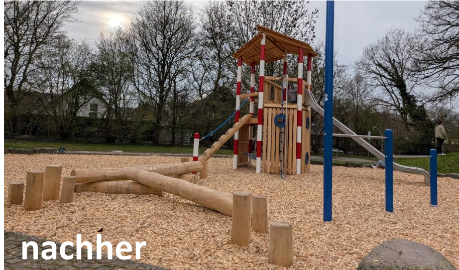
Projekt: Sp Rügenweg