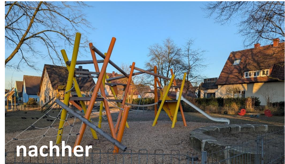
Projekt: Sp Dahlienweg