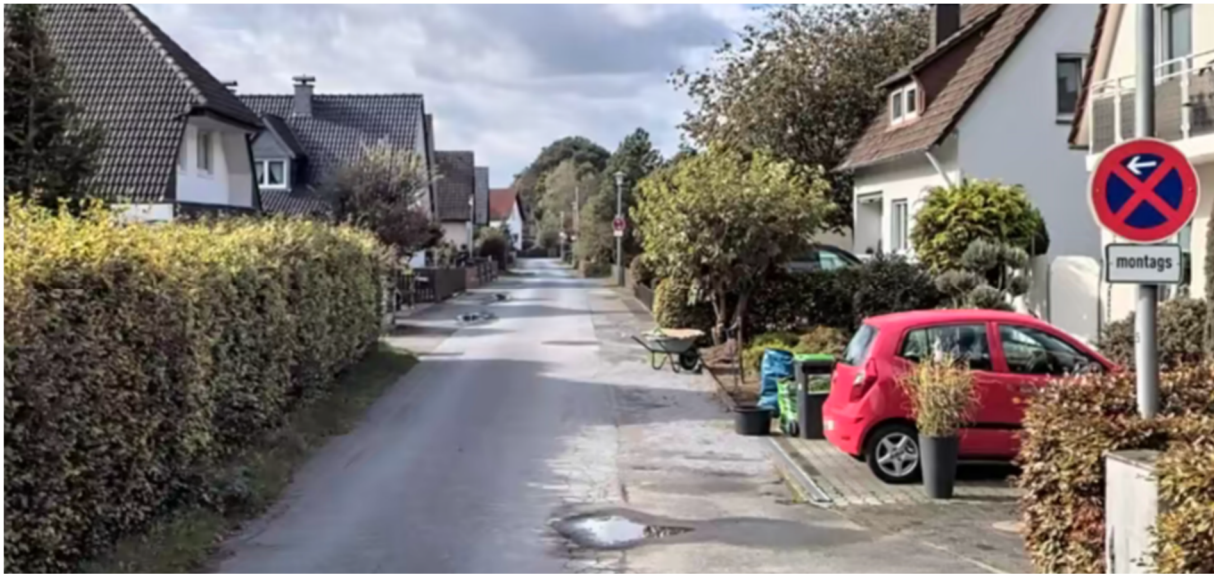
Abb.: Auszug aus Apple Maps, Blick auf die Beethovenstraße.

sind die betreffenden Straßen heute als einfache Asphaltfläche (teils) nebst Straßenbeleuchtung hergestellt.